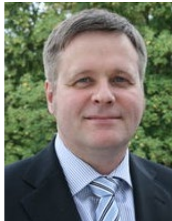
Institut für Verkehrswirtschaft