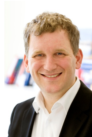
Institut für Logistik (SCM)