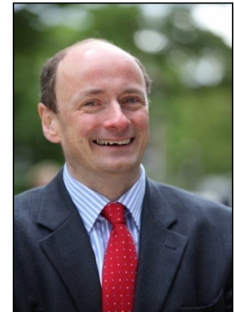
Institut für Operations Research