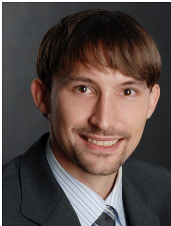
Institut für Operations Management